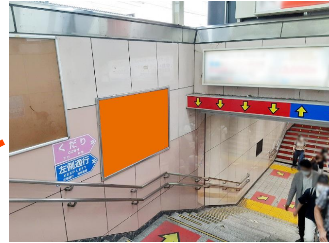
新大久保駅 現地参考写真

QRコードを表示できないポスターボードがあります。 駅工事などによりポスターボードの位置が変わる場合がございます。 最新の情報は「 資料請求・ご相談フォーム 」よりお問い合わせください。 更新:2024年05月